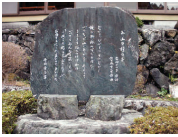
▲東京都青梅市にある、童謡「お山の杉の子」の記念碑。いつの時代も、子どもたちは明るい未来の担い手です。