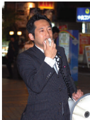
▲毎月開催されている、青年部青年局の街頭演説。