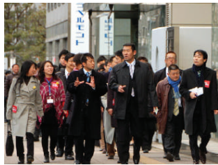
▲青年部青年局として、元プロ野球選手の石井浩郎参議院議員と視察同行。地域のスポーツ振興にも活性化が期待されます。